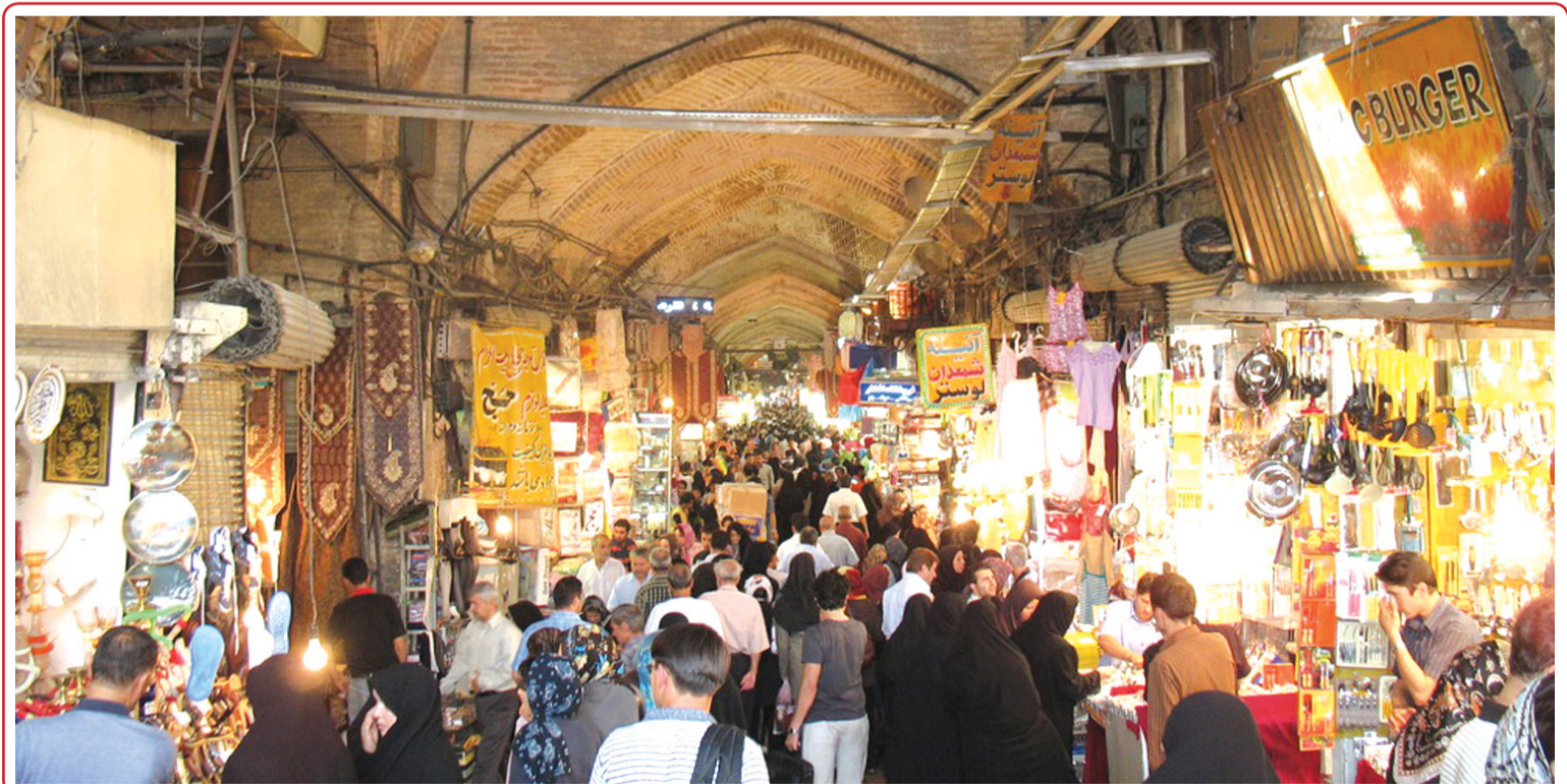
روزهای پایانی سال به روایت تصویر

همچنین در این حالت؛ ضربان قلب هم افزایش پیدا می‌کند و خون‌رسانی به بدن بهتر می‌شود. پوشش عروق خونی پس از دیدن یک فیلم خنده‌دار به میزان قابل توجهی منبسط می‌شود و مقداری از مواد شیمیایی که برای بدن مفید هستند؛ آزاد می‌شوند این مواد التهاب و بسیاری از واکنش‌های مضر را کاهش می‌دهد. در حالی که در هنگام انقباض پوشش عروق مقداری از هورمونهای استرس نظیر کورتیزول آزاد می‌شوند که در درازمدت اثرات قلبی - عروقی مخربی را برای بدن دارند. خندیدن و شوخی کردن؛ روش‌های مثبتی برای ابراز احساس و هیجانات خوشایند است و تأثیر بسیار خوبی بر روح و روان می‌گذارد؛ اضطراب و استرس را کم می‌کند و ترس و تردید را کاهش می‌دهد. در دورانی که مشکلات انسان‌ها اعم از